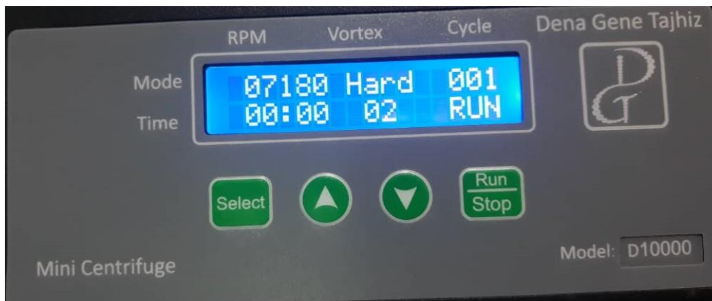
شکل 2. پنل کاربری دستگاه حین کار

❖ با زدن دکمه پاور دستگاه پنل کاربری روشن خواهد شد.